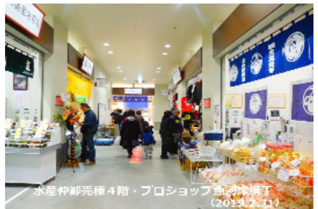
水産卸売場棟4階・プロショップ 魚河岸通り (2019.2.21)