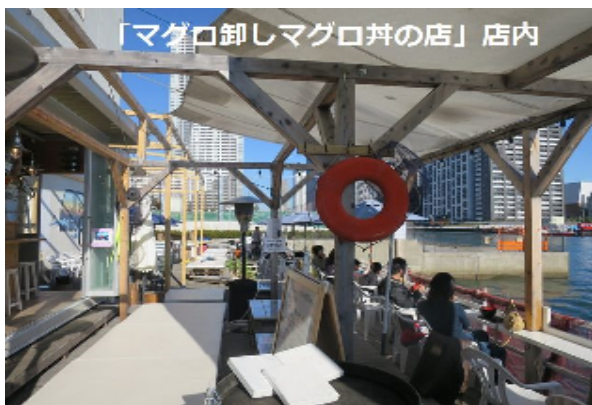
「マグロ餅りマグロ丼の店」店内