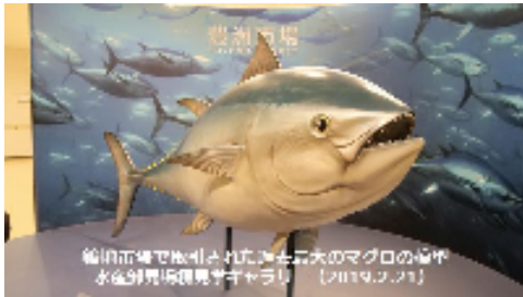
輸送市場で展示された、海上最大のマグロの模型 水産卸売場観覧デッキより (2019.2.21)